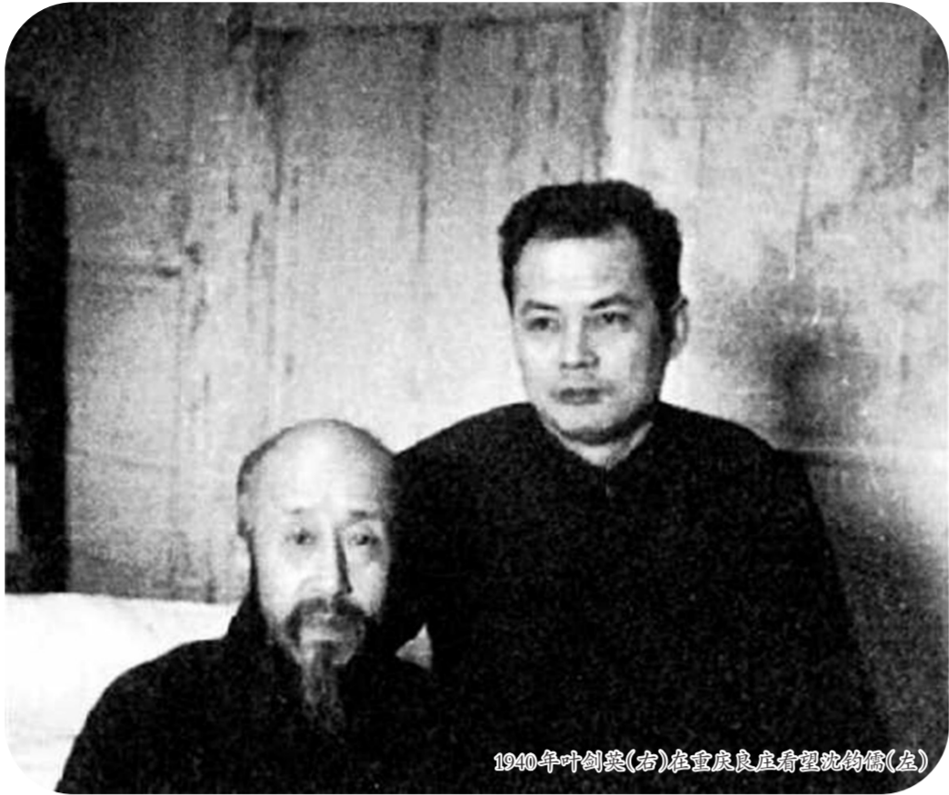
1940年叶剑英(右)在重庆良庄看望抗联的儒(左)

前就预料到国民党方面会对共产党和八路军进行攻击,他和有关人员一起搜集资料,分析形势,研究大局为重,充分摆事实,讲道理,晓以大义,争取更多人的同情和支持,粉碎国民党顽固派的阴谋诡计。